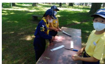
上手にできたかな？